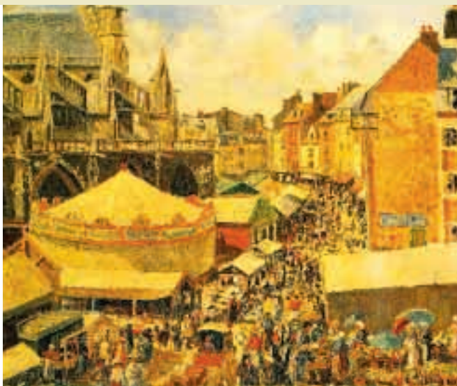
AL PRIMO POSTO HONG KONG, ALL'ULTIMO COREA DEL NORD (COMUNISTA). USA AL 15°, ITALIA AL 26°, IRAK NON Pervenuto.

In maniera comparativa, vengono così valutate le singole situazioni di corruzione giudiziaria, doganale e governativa; la presenza di tariffe sulle importazioni in grado di frenare gli scambi; la